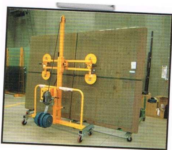
Ottimo caricatore per banchi di taglio incinabili

Alimentazione della pompa del vuoto a batteria. La testa rotante è dotata di n. 4 ventose: sale e si abbassa tramite robuste carrucole manuali. Ingombro di spazio ridotto: 600 mm. di larghezza base x altezza 2000 mm. La struttura è zavorrata per l'antiribaltamento. Peso proprio del carrello kg. 450