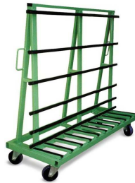
Ottimo caricatore per macchine levigatrici